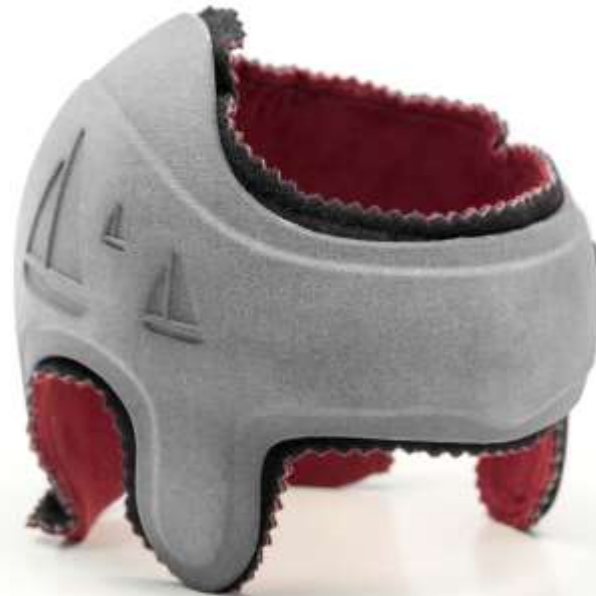
Casque Chabloz Plagio