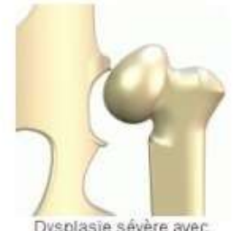
Dysplasie sévère avec luxation de la tête fémorale