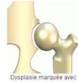
Dysplasie marquée avec arthrose et subluxation de la tête fémorale